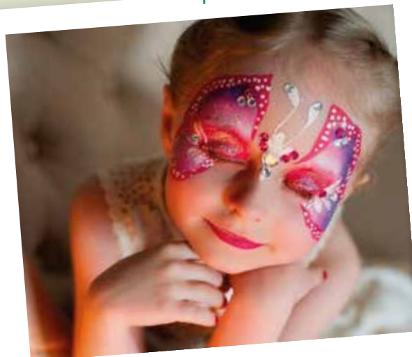
АКВАГРИМ от 3.000 /час