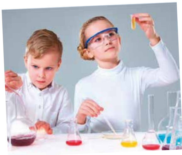
ХИМИЧЕСКОЕ ШОУ от 7.000 /30 мин