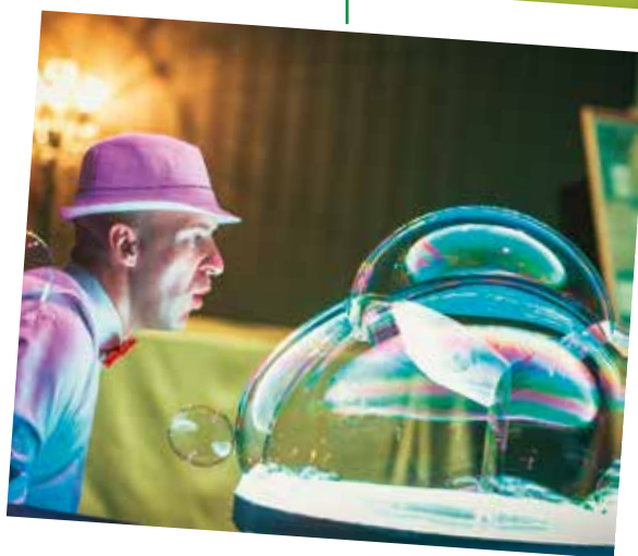
МЫЛЬНЫЕ ПУЗЫРИ от 4.000 /30 мин