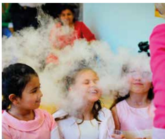
КРИОШОУ + НАНОМОРОЖЕНОЕ от 8.000 /30 мин